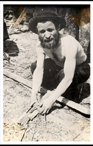
דרוהוביץ', עובד כפייה יהודי מועסק באיסוף גורדי עץ Jewish forced labourer, Drohobycz