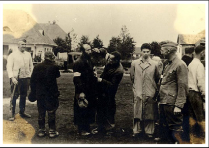
דרוהוביץ', חייל אס-פוקד על יהודי לגזור את זקנו של יהודי אחר SS forcing a Jew to cut the beard of another Jew, Drohobycz