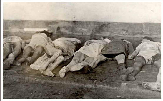
לבו, גופות קורבנות לאחר הפוגרום

Lwów: A woman and a girl who were abused during a pogrom