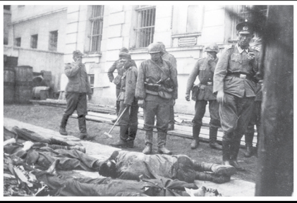
חיילי הוורמאכט מתבוננים בגופות יהודים

Lwów: A woman forced to kneel with her raised hands