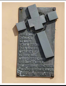
שלט זיכרון לקורבנות הנקוו"ד בבניין המטה לשעבר בבוריסלב

Prisoners tortured and murdered by the Soviet NKVD in Boryslaw