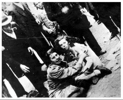
לבו, אישה וילדה אשר הותקפו בפוגרום, 1941