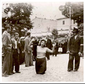
לבו, אישה יהודייה אולצה לכרוע ברך בידיים מורמות

Memorial plaque commemorating the NKVD victims at the former NKVD headquarters, Boryslaw