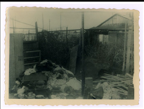
מחבוא שנתגלה מתחת לכולובי שפנים

בקיץ 1944 נעה החזית מערבה בעוד כוחות הברית תוקפים מן האוויר את הצבא הגרמני הנסוג. האקציות בדוהוביץ' ובוריסלב נמשכו במטרה לחסל את היהודים ששרדו במקומות מסתור. אלה שנתפסו, נרצחו במקום או הועברו למחנה מרז'ניצה ומשם נשלחו לפלאשוב או אושוויץ. המשלוח האחרון יצא מבוריסלב לאושוויץ בראשית חודש אוגוסט, סמוך לשחרור.