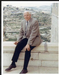
אברהרד הלמריך בירושלים, 1968