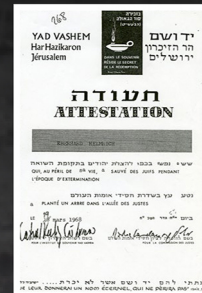
אברהרד ודונטה הלמריך, חסידי אומות העולם