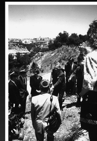
הזוג בייץ בעת נטיעת עצים בשדרת חסידי אומות העולם ביד ושם, 7.5.1990

Planting a tree on Yad Vashem's Avenue of the Righteous, 7.5.1990