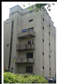
בנייני ההנהלה של חברת הנפט הקרפטית (בסקידן)