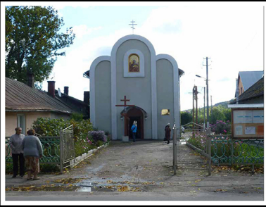
בוריסלב, בית הקולנוע לשעבר, קולוסיאום. מקום ריכוז יהודים בשנים 1942–1944

The former Colosseum cinema in Boryslaw, a collection site 1942–1944