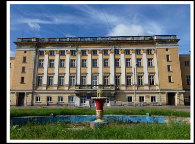
בניין סוקול בדרוהוביץ', אשר שימש מקום ריכוז

Drohobycz Jews herded together for so-called 'resettlement'