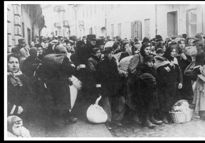
יהודים מדרוהוביץ' מובלים לקראת "יישוב מחדש"

The former Colosseum cinema in Boryslaw, a collection site 1942–1944