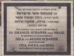
שפר ז"ל ושלט ההנצחה בבית העלמין של יהודי סטיבלוב

עשתה את צרכיה על אודי הבורות, תורתני סימוא את חיומה רבבות יהודים. אליה הודרים של שפר והבכא הסכסנה שלנו וחי באחת מקומו