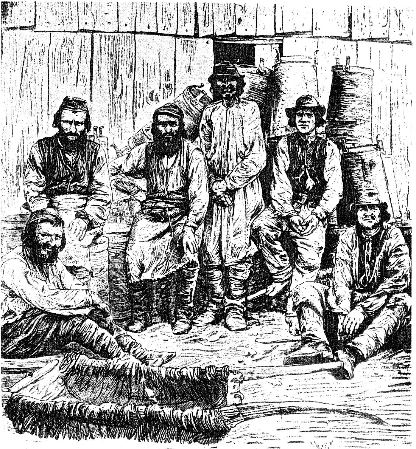
בוריסלאב — פועלים יהודים עובדי בארות נפט, סוף המאה ה־19 או תחילת המאה ה־20